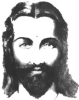
Maitreya El Señor