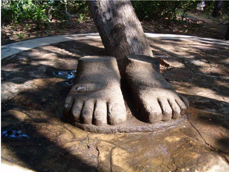
LOS PIES DEL MAESTRO Escultura del Centro de Curación Planetaria, Visakhapatnam

tiene que ver para él mismo, cual es la relación que le gustaría desarrollar con el Maestro. Eso es más importante. Gracias.